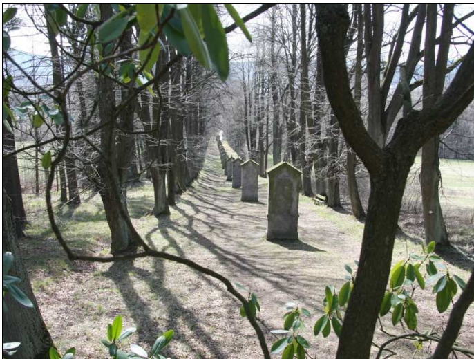
Křížový vrch (Kalvarienberg) bei Cvikov