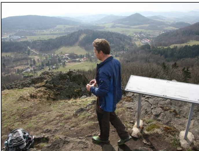
Blick vom Střední vrch (Mittenberg)