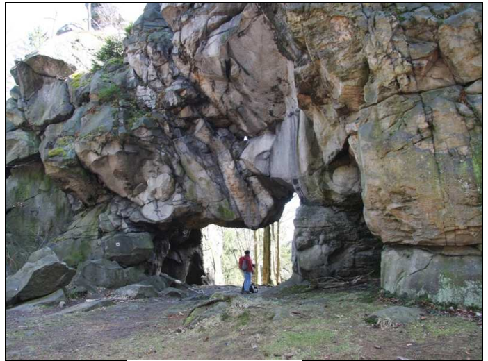
Felsentor Milštejn (Mühlstein)