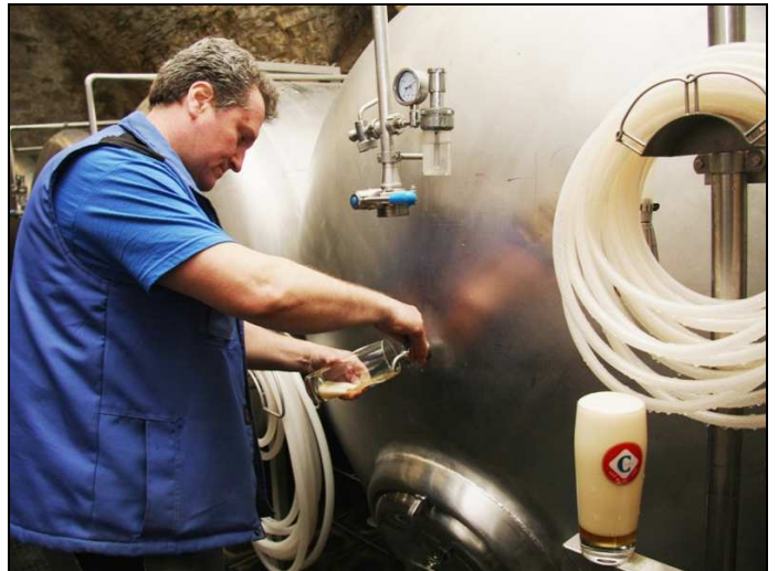
Hier darf probiert werden