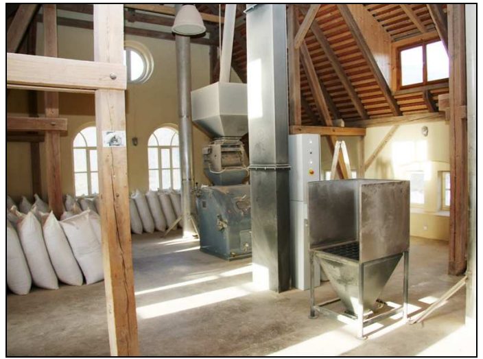
Führung durch die Brauerei Cvikov