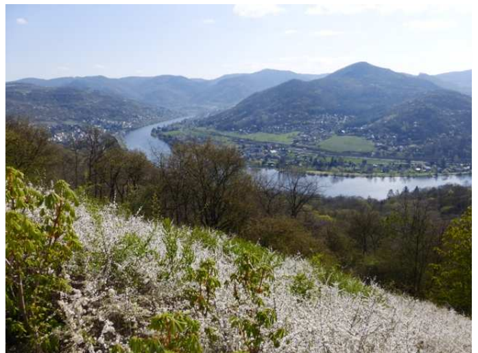
Die Elbkurve unterhalb des Daubitzer Kirchleins