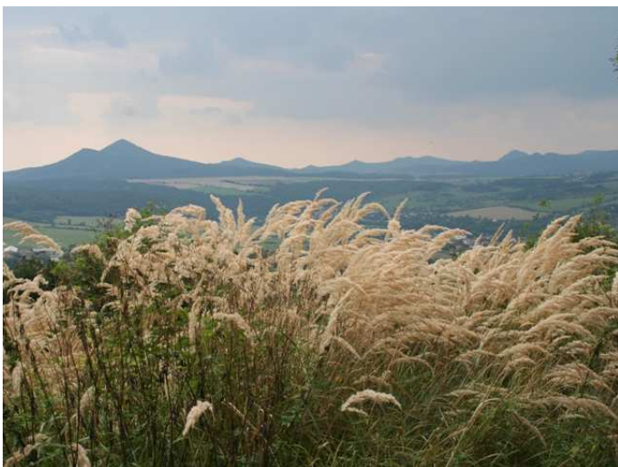
Silhouette des Böhmischem Mittelgebirges nach Westen