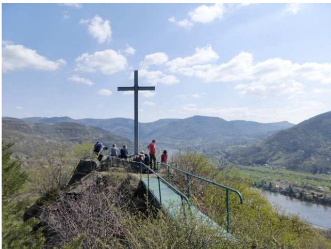
Aussicht am Müllerstein