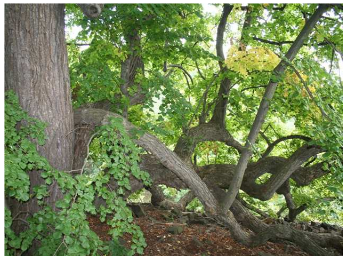
Mächtige Linden am Plesivec