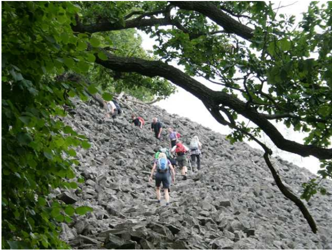
Aufstieg zum Plesivec (Eisberg) ...