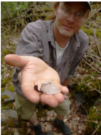
Eis im Juni am Fuße des Plesivec