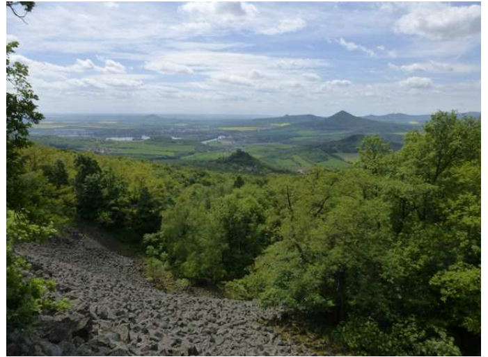
... und dann der herrliche Blick von oben