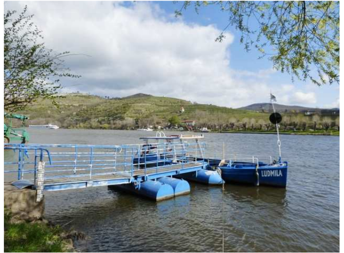
Fähre nach Groß-Tschernosek