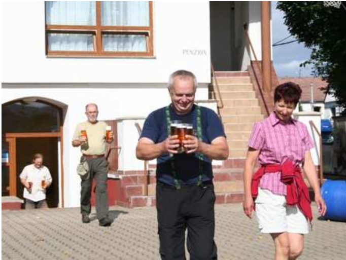
Durstlöscher am Daubitzer Kirchlein